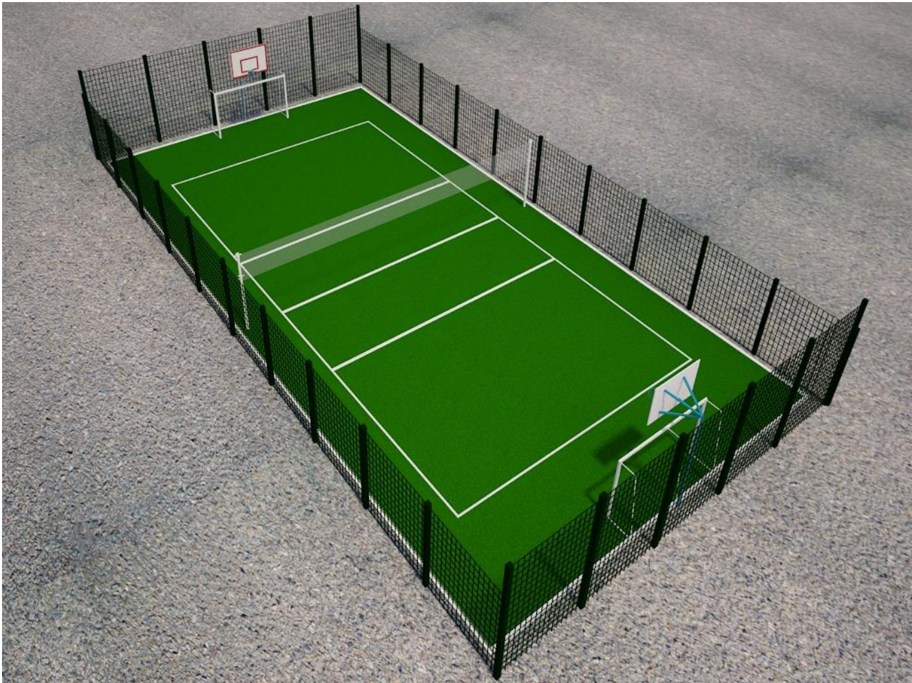
Таблиця розрахунку вартості спортивного майданчика площею 240 м 2 з покриттям «штучна трава», висота ворсу 20 мм, тип ворсу фібрильована